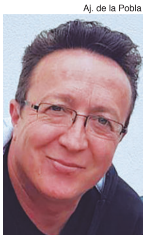
Aj. de la Pobla

En les properes setmanes s'acabaran de definir les competències que assumirà el nou edil republicà i quedarà tancat el nou cartipàs municipal.