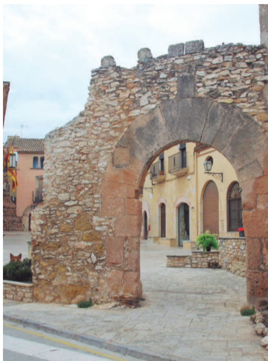
Les dues imatges d'Altafulla no són iguals. Troba les 7 diferències.