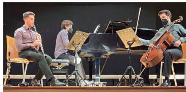
A pesar de la Covid, enguany Sant Jordi s'ha celebrat amb diferents propostes culturals

"Masks". El concert va ser molt ben acollit i valorat pel públic assistent.