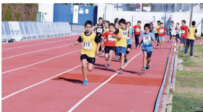
Un any més la prova va ser un èxit