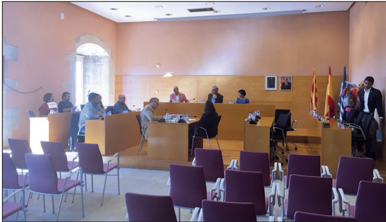
Un a un van abandonar la sala davant l'estupor del govern. (Foto: JG - El Mònic).

Tots els partits polítics de l'oposició van considerar una falta de respecte el comportament de l'equip de govern amb els pressupostos. P2.