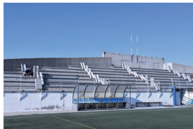
Les obres tenen un cost de 26.000 €

Les tasques principals previstes són les següents: reparació de la graderia de formigó, posterior neteja i impermeabilització de les grades i graons i acabat final de protecció amb resina d'altres prestacions. També es repintaran les baranes de les grades i se substituirà la xemeneia existent en estat de corrosió per una de nova d'acer inoxidable. A més, s'instal·larà una marques-