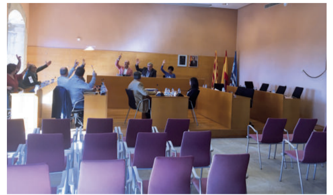
El govern es va trobar votant sol un dels punts més importants de l'any

rents punts de vista, els regidors de l'oposició han abandonat la sala de plens davant de l'estupor de l'equip de govern. Avui Democràcia, la CUP i Ciutadans ho han fet al finalitzar les seves intervencions; el PP a l'acabar