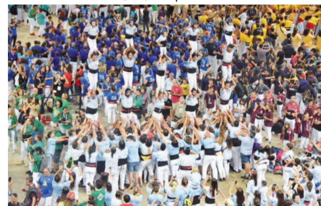
Per finalitzar, els Nois van construir cinc pilars

Finalment, l'actuació va consistir en un 5 de 7, un treballat 7 de 7 i un 3 de 7 aixecat per sota.