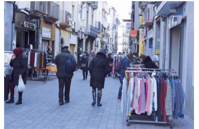
Tot i els nous criteris les fires comercials es podran continuar portant a terme com fins ara

El principal canvi que comporten aquests nous criteris és que l'ocupació de la via pública es limita a un màxim de 2m2 per establiment. També es regula l'alçada màxima