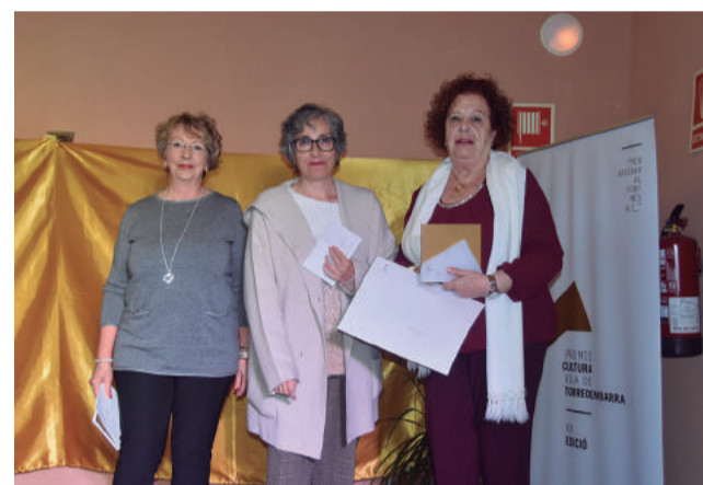
Dos moments dels actes que van destacar per la poca presència de públic

més veteranes dels Premis Torredembarra, dedicada a premiar la producció inèdita i en català d'aquest gènere literari.