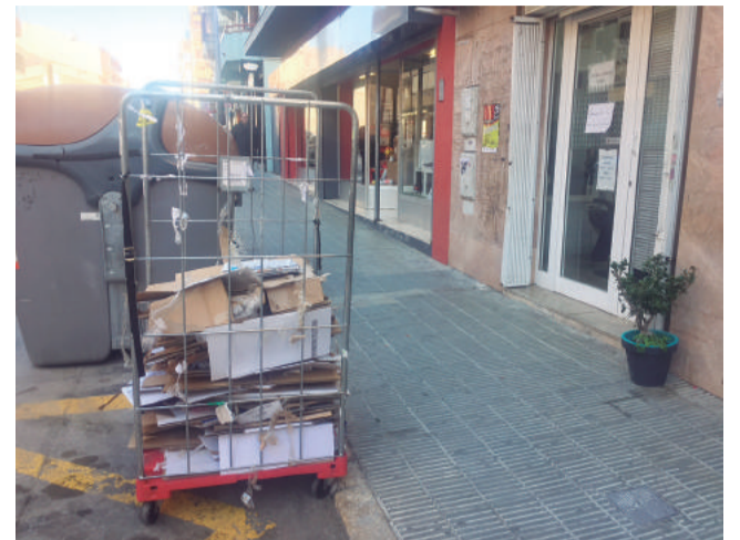
Un establiment recull el cartó generat al c/ Pere Badia

De fet, ja hi ha qui ho fa. L'estalvi ha estat espectacular a pesar de pagar els 115 € obligatoris de la taxa municipal, atès que en to-