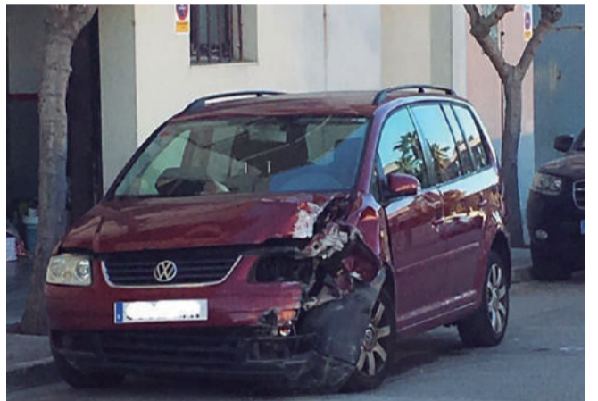
Estat del vehicle

Fa un any, Solé va ser denunciat per conduir durant tres mesos sense assegurança i amb l'ITV caducada. En aquest cas, tenia tots els papers en regla