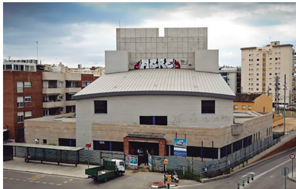
El jutge està investigant si l'empresa constructora del teatre va finançar amb 40.000 euros la campanya de CIU de 2011

Per altra banda, el proper 14 de desembre, el representant legal de la constructora Transcornejo declararà davant el jutge Josep Bosch. Ho farà