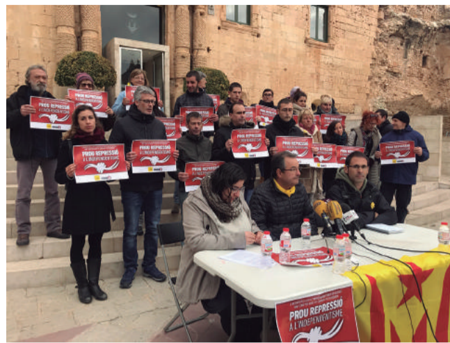
Membres de la CUP van protestar davant la porta de l'Ajuntament

Des de l'aplicació de l'article 155 que ho recla-