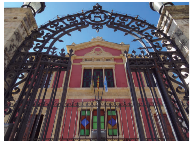
Façana principal vista des de la porta