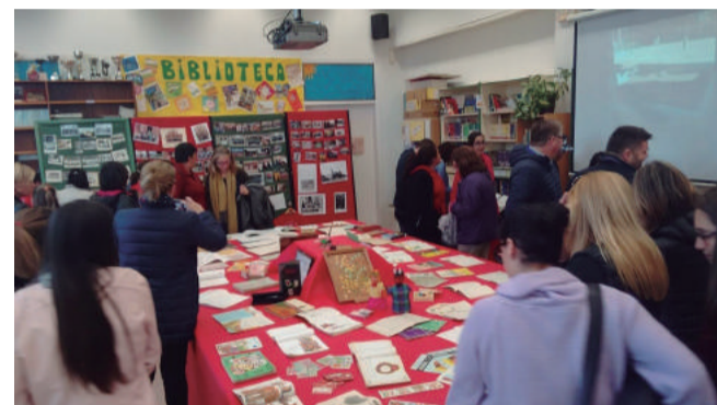
El CEIP ha aprofitat la setmana cultural del centre per commemorar el seu 125 aniversari

vivències explicades pels pares, mares, àvies... en les entrevistes que els han fet els nens i nenes com a exalumnes de diferents èpoques.