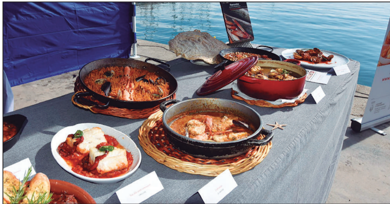
Alguns plats que van realitzar-se per la presentació de la Mostra.

No ha funcionat. Des de l'administració s'apunta a la falta d'implicació dels restauradors. Els restauradors apunten a l'Ajuntament d'errar en la iniciativa i no acompanyar-la de totes les actuacions que es van anunciar en el seu moment. P 2