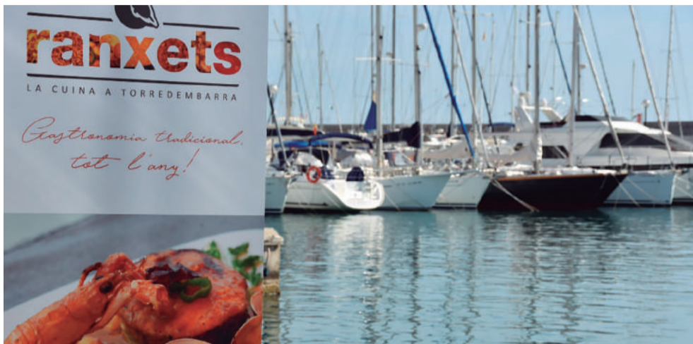
Imatge promocional de la marca ranxets

Va coincidir que l'Ajuntament va canviar de criteri polític i va promocionar que sorgís una associació de restauradors, amb l'objectiu de tenir un únic interlocutor. Va ser a través d'aquesta associació que es van organitzar les